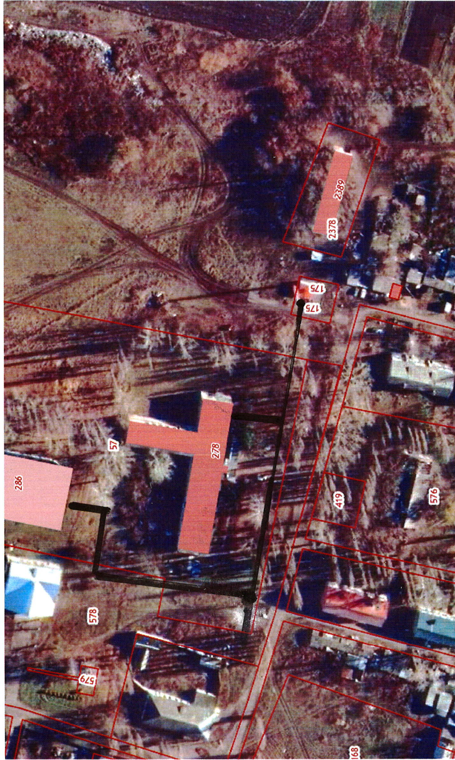
Схема теплоснабжения Парижскокоммунского сельского поселения Верхнехавского муниципального района Воронежской области